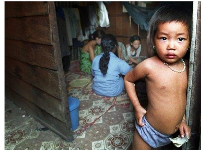
雛妓在午間休息、玩牌消磨時間，準備晚間接客。

過去數十年，斯維帕克與柬埔寨其他地區因人口販運而惡名昭彰，狹窄巷弄內的妓院中，不只有當地的婦女、少女、女童被迫以低廉的價格接客，更有許多處於柬埔寨社會邊緣的越南女性與女孩也在簡陋的隔間和床板間受苦。